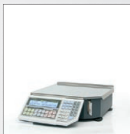
«ШТРИХ-ПРИНТ» Ф1 4.5

Весы «ШТРИХ-ПРИНТ» М 4.5 — наиболее популярная компоновка, при которой клавиатура весов для эргономичности размещена внизу, чтобы для ввода номера PLU товара оператору не приходилось каждый раз поднимать руку. Дисплеи оператора и покупателя помещены на стойке, то есть элементы индикации весов вынесены из зоны повышенной загрязнённости. Благодаря установке на высокой и устойчивой стойке дисплей покупателя хорошо виден над холодильными витринами-прилавками.