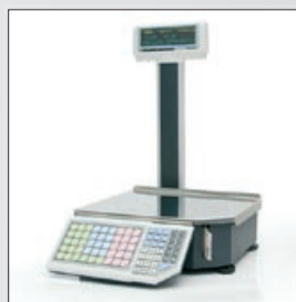
«ШТРИХ-ПРИНТ» М 4.5